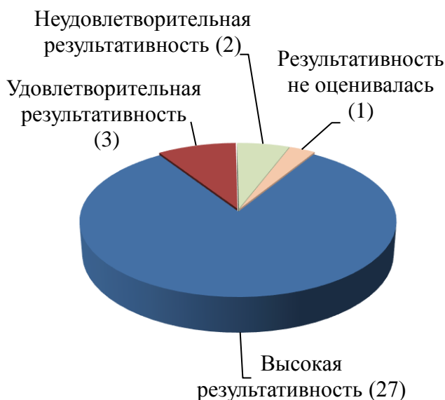
Количество государственных программ Тульской области