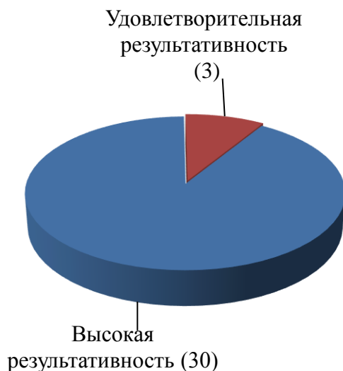
Количество государственных программ Тульской области