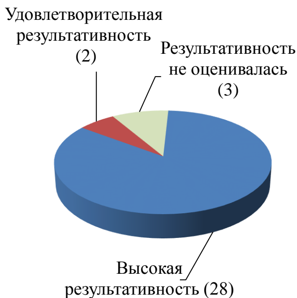
Количество государственных программ Тульской области